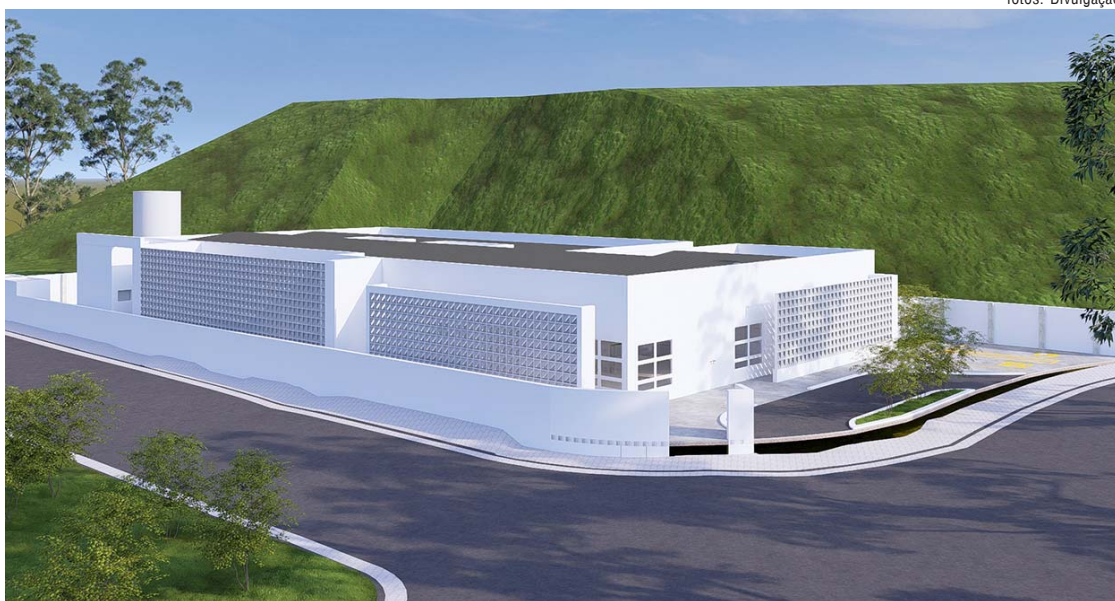
Imagem em perspectiva arquitetônica da UBS João Cândido.

A UBS João Cândido será erguida na Av. Cid Nelson Jordano com a Rua Maria Patrícia da Silva e terá 684 m 2 , assim como a UBS Cerro Largo que está em construção no Sítio das Madres. A unidade também será Porte III, segundo critérios do Ministério da Saúde, e contará com equipes de Saúde da Família, Saúde Bucal e equipes multiprofissionais, essencial para ampliar o acesso aos serviços de Atenção