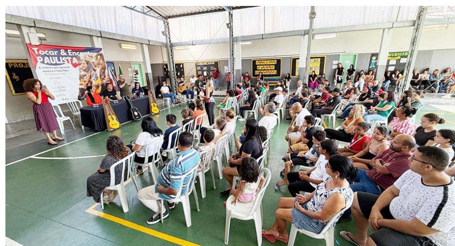
Projeto Tocar & Encantar atende alunos da EMEB Heitor Villa Lobos com aulas gratuitas de violão e flauta doce.

A apresentação do projeto para as famílias ocorreu no sábado, 14 de março, contou com