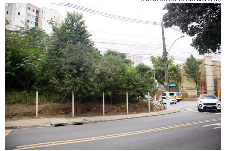
UBS João Cândido será construída em terreno na Av. Cid Nelson Jordano com a Rua Maria Patrícia da Silva.

Primária em Saúde de forma humanizada e acessível.