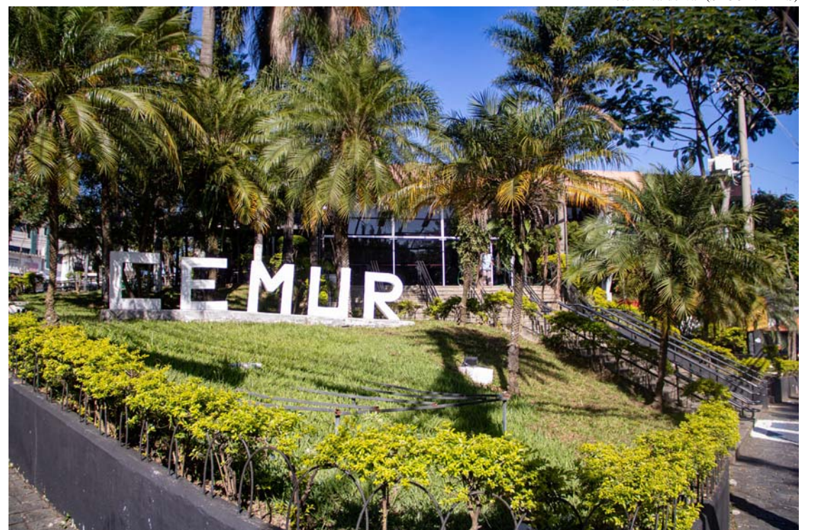
Cemur recebe Audiência Pública do Plano Municipal de Mobilidade Urbana em 23/04.

Serviço: Audiência Pública - Plano Municipal de Mobilidade Urbana 23 de abril - a partir das 18h Local: Cemur - Praça Nicola Vivilechio, 151, Jd. Bontempo