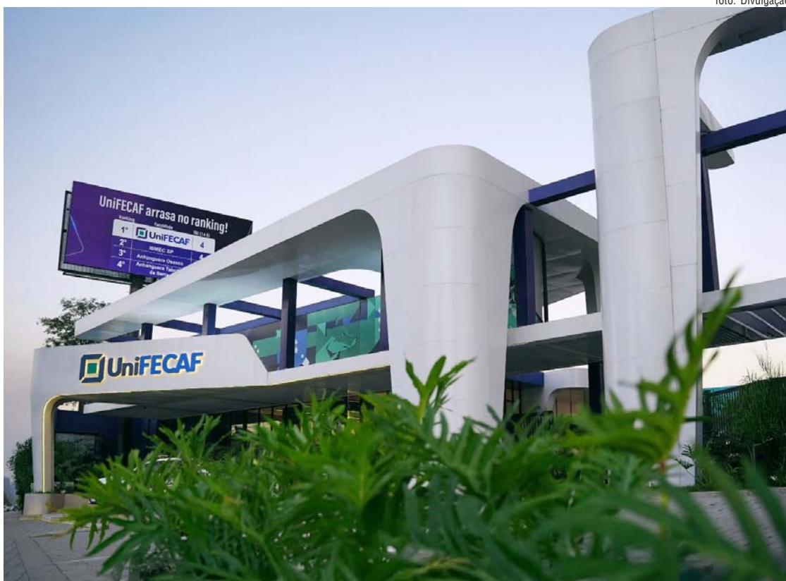
1º Congresso do Transtorno do Espectro Autista será realizado na UniFECAF - Campus Centro.

O evento é gratuito e contará com diversas atividades para a população, em especial para pessoas com TEA e suas famílias. Haverá orientação jurídica pela OAB e atendimentos nas áreas de psicoló-