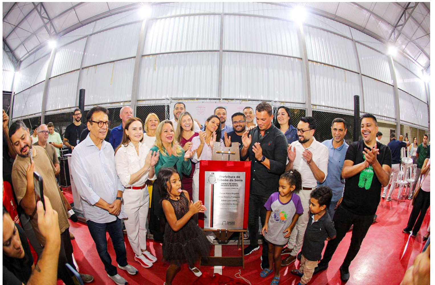
Revitalizados, Programa Conecta - Moda, Beleza e Estética e Fundo Social são entregues para a população de Taboão da Serra.

tas, promove autonomia e fortalece a economia da nossa cidade. Essa escola é mais uma ferramenta para transformar vidas por meio do trabalho e do conhecimento”, afirmou.