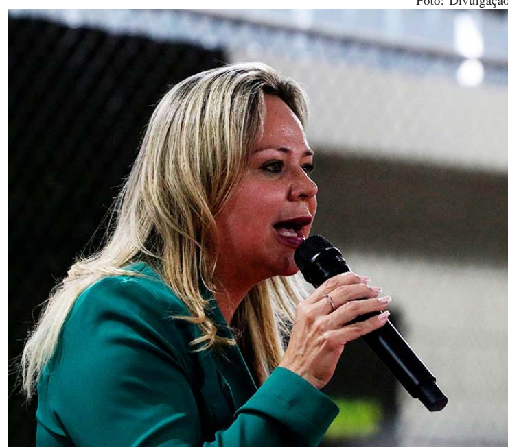
A vice-prefeita Érica Franquini durante evento de reinauguração do projeto Lado a Lado que faz parte do Conecta

A reinauguração do Lado a Lado, que passa a integrar o projeto Conecta, no Jd. Saporito, em Taboão da Serra, marca a retomada de uma importante política pública voltada à qualificação profissional e ao empoderamento de mulheres em situação de vulnerabilidade. O evento aconteceu nesta quarta-feira, dia 8.