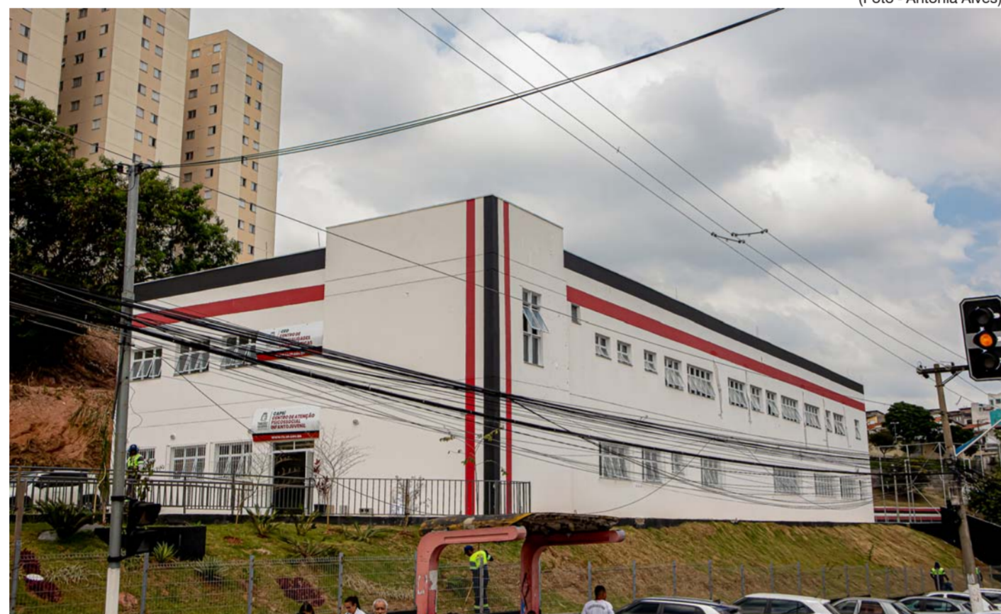
Emendas destinadas contemplou a construção do novo equipamento de saúde CEO (Centro de Especialidades Odontológicas) e o CAPSI (Centro de Atenção Psicossocial Infantil)