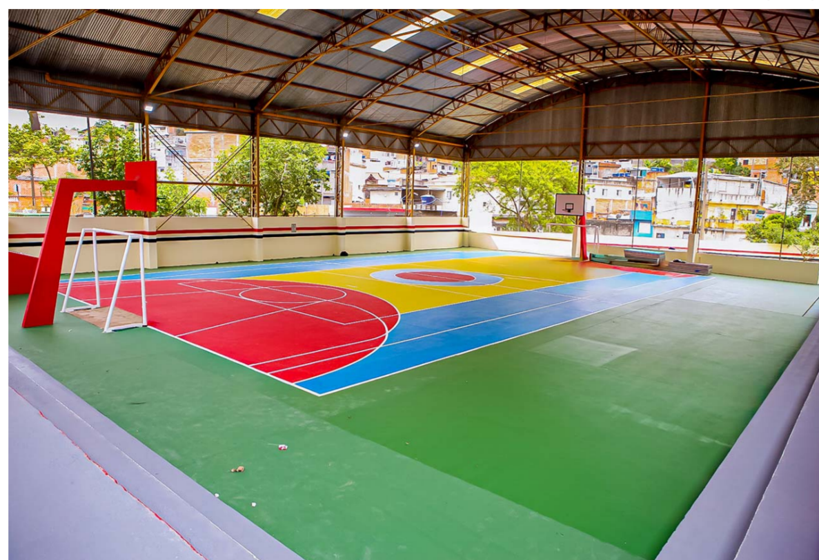
Programa Escola Mais Bonita tem contemplado a reforma das escolas municipais de Taboão da Serra