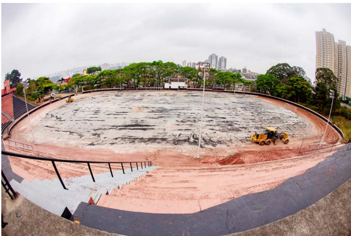
Estádio Municipal Jose Feres será totalmente reformado para atender jogos da Federação Paulista de Futebol e Campeonatos Municipais